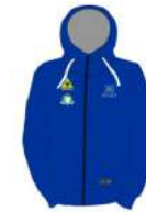
Polar Bears - VZC Veenendaal